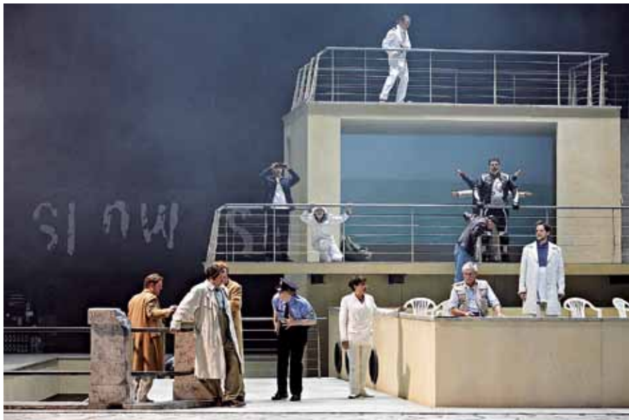
Scene from Fremd